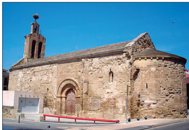
FIGURA 5. Església de Sant Martí de Lleida (segles XII-XIII) (Fotografia: Francesc Fité).

del monestir i de l'església va tenir lloc en la segona meitat del segle esmentat. 57