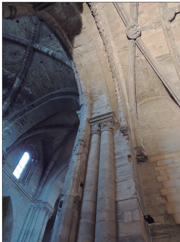
FIGURA 11. Col·lateral sud de la Seu Vella de Lleida, vist des de la nau (segle XIII).

segle XII el projecte ja era en marxa. Per la tipologia d'edifici, un cop més es va haver de recórrer a un model de fortalesa forana. Tal com la doctora Español va remarcar, el model que s'adoptà fou el del castell de planta regular, segons la tipologia que es difonia aleshores, l'anomenada «Felip August» pel fet d'aparèixer durant el seu regnat (1187-1223). 68 El seu origen sembla que cal cercar-lo en l'arquitectura de Terra Santa, on aquest rei l'hauria vist. En tot cas, suposà un canvi revolucionari respecte al castell romànic tradicional. Al nostre país i a Aragó sembla que fonamentalment l'introduïren els ordes militars (Miravet, Alcanyís, Sàdaba, Mequinensa...), però a Lleida fou el rei Pere el Catòlic (1196-1213). 69 A Itàlia, en canvi, foren els Staufen, segons es demostra pels castells d'Ursino (Catània), Maniace (Siracusa) i Prato. En la seva configuració tot fa pensar que hi conflüïren la tradició romana, el coneixement del manuals clàssics de poliorcètica i sobre-