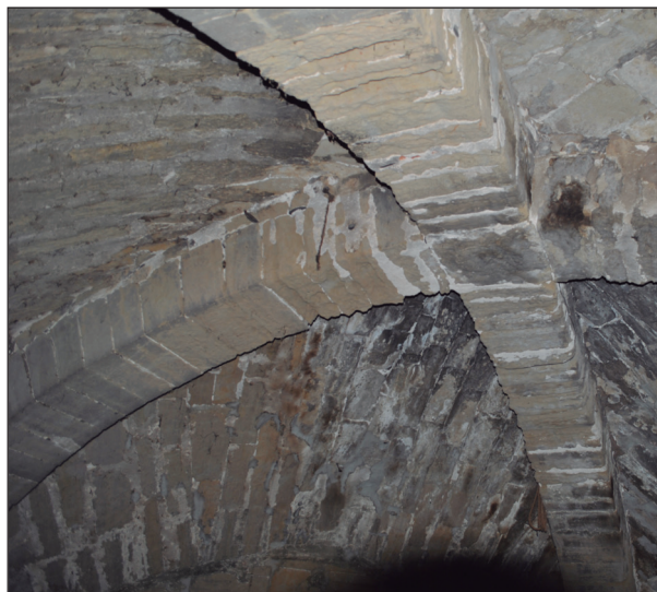
FIGURA 8. Volta del tram sud del transsepte de Sant Ruf de Lleida (segles XII-XIII) (Fotografia: Albert Motis).