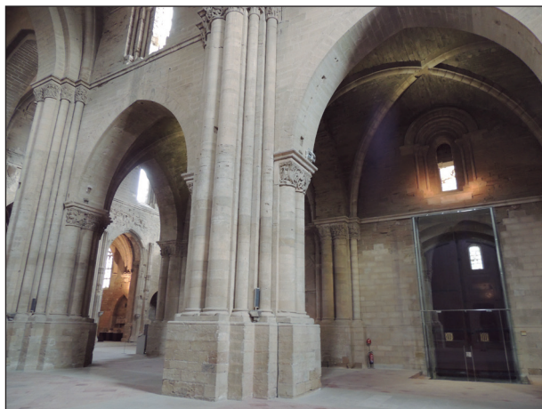
FIGURA 12. Detall del braç sud del transepte de la Seu Vella, vist des de la capella Colom (segle XIII).

que devia estar bastant avançada, ja que en la crònica de Jaume I, el seu fill i successor, ja es parla de reformes. 71 Abans de continuar cal que recordem també que aquest rei estigué present a la cerimònia de col·locació de la primera pedra de la catedral de Lleida, el 1203. Podem afegir a aquesta dada el nom del mestre d'obra que portà a terme les reformes en època de Jaume I, Pere de Prenafeta, mestre d'obra del castell del rei, a qui el monarca concedí el 1259 la Torre de Besora, propera al recinte de la Suda, i el 1273, una pedrera annexa a aquesta torre. 72 Volem recordar que aquest