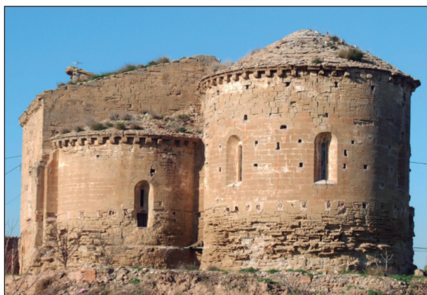
FIGURA 7. Vista general des de la capçalera de Sant Ruf de Lleida (segles XII-XIII).