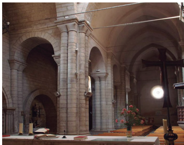
FIGURA 9. Interior de la nau de Santa Maria de Tamarit de Llitera (segle XIII).

mur d'aquest absis el remata externament un ràfec de motllura llisa sostingut per permòdols també llisos, tal com veiem en moltes esglésies dels segles XII i XIII de la zona. Constructivament, Sant Ruf es pot situar en la línia de Santa Maria la Major de Tamarit de Llitera, a cavall dels segles XII i XIII.