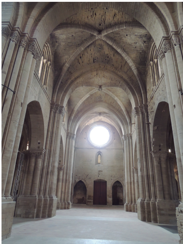
FIGURA 10. Nau principal de la Seu Vella de Lleida (segle XIII) (Fotografia: Francesc Fité).