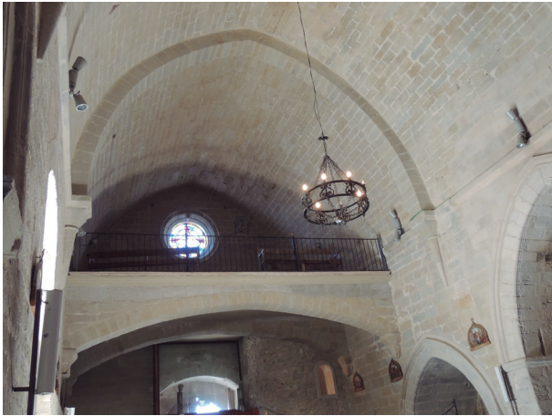
FIGURA 14. Interior de la nau de Sant Salvador de Vilanova de Meià.

La parròquia de la Magdalena, de la qual no consten notícies fins al 1984, mercès a les prospeccions arqueològiques que feren aflorar els seus vestigis cal creure que era molt semblant a Sant Joan, d'una sola nau. Com en el casos anteriors, l'edifici fou modificat en època gòtica, molt possiblement la coberta, a la qual s'afegí un cimbori; també se li adossà un campanar com a Sant Joan. Una explosió del polvorí, el 1812, l'arruïnà, tot i que subsistiren restes fins al 1838, any en què fou enderrocada del tot. 83