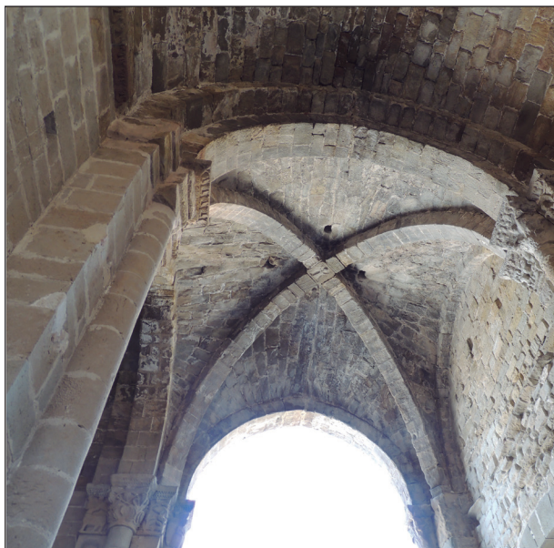
FIGURA 6. Vista del creuer de Sant Miquel de Camarasa per l'interior (segles XII-XIII).

se li obrí una porta d'accés d'arc de mig punt amb dovelles estretes, a un nivell més elevat que el terra, i una finestra de trets romànics, de doble esqueixada, també conservada. L'absis sud s'obre al transsepte a través d'un arc presbiteral, i l'absis central, més gran, s'obre mitjançant un arc ressaltat i apuntat sostingut per columnes, com les de les ales del transsepte. També hi ha dues finestres de doble esqueixada, la citada del mur oest, i una altra, alterada, al costat sud, així com tres més a l'absis central. Al tester del braç sud del transsepte, hi ha una altra porta d'arc de mig punt dovellada i amb guardapols de motllura llisa, semblant a la porta de Sant Berenguer de la Seu Vella o a la de Sant Martí, que se situen cronològicament al primer terç del segle XIII. 60 Cal indicar que, com en altres exemples, el