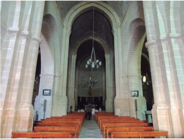
FIGURA 1. Interior de la nau de Santa Maria d'Agramunt (segles XII-XIII)

ment, mirà de protegir els artesans de la seda i els ceramistes islàmics. Eiximenis mateix, que rebutjava l'arquitectura islàmica, valorava molt la ceràmica vidriada de reflex daurat fabricada pels mudèjars. 31