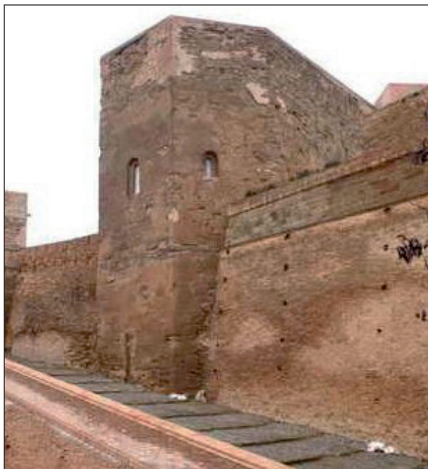
FIGURA 4. Vista exterior de Santa Maria del Castell de Montsó, a Osca (segles XII-XIII).

tana, i cap no coincideix amb el toral afegit. L'autor creu que en ple segle XII foren introduïts a Gardeny, des d'on a partir de mitjan segle XIII es difongueren, com hauria estat el cas del santuari del Merli, a Alguaire, on apareixen. 55 Podem resumir que es tracta d'un temple molt sobri, com corresponia pel seu caràcter castral i per pertànyer als templers. En tot cas, la cronologia proposada sorprèn per la fabrica de l'església, que s'adiu més al segle XIII. En aquest sentit, Fuguet recalca l'arribada de picapedrers occitans, com ja hem assenyalat, els primers presents a les nostres terres, i fins i tot, glossant Lladonosa, proposa que després de Gardeny podrien haver estat contractats per a treballar a la Seu Vella a partir de l'any 1193. 56