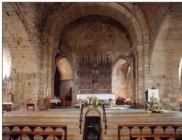
FIGURA 13. Nau interior de Sant Llorenç de Lleida (segle XIII) (Fotografia: Francesc Fité).

mercaders i comerciants del barri, alguns d'establerts al carrer Cavallers, com els Gralla, els Caldera, els Tàrrega o els Monsuar, feren importants fundacions. 81