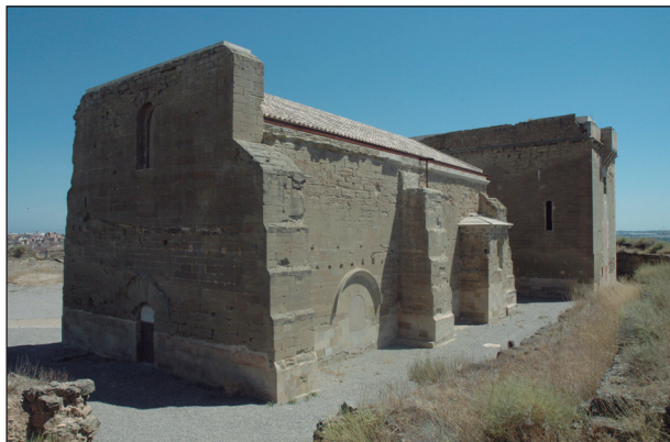
FIGURA 3. Vista exterior des de ponent de Santa Maria de Gardeny, a Lleida (segles XII-XIII) (Fotografia: Francesc Fité).

la deixa d'una candela perquè cremés nit i de dia «coram altare beate Marie» de Gardeny. 52 A més, hi ha constància que abans del 1260 hi havia una capella propera a l'absis, oberta al mur meridional, ja que el 3 de juliol d'aquell any, Bernarda Sança, que fou muller de Tomàs de Santcliment, dictava testament elegint com a lloc de sepultura la capella «quam pater meus edificavit in domo Gardeni». Una capella que conserva encara restes de pintura que es daten precisament d'aquest moment. Vista per l'exterior, es percep clarament que s'encavalla al contrafort, motiu pel qual la seva edificació ha de datar-se a la primeria del segle XIII, és a dir, uns anys abans de l'execució de les pintures. 53